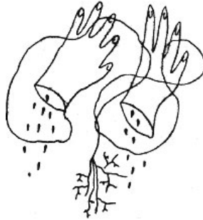
Manos cortadas, 1935-36 – FG Lorca

Estos poemas, su desenfadada homosexualidad, y la firma del Manifiesto a favor del Frente Popular, que ganó las elecciones del año 36 en España, fueron los motivos que activaron la mano de sus asesinos.